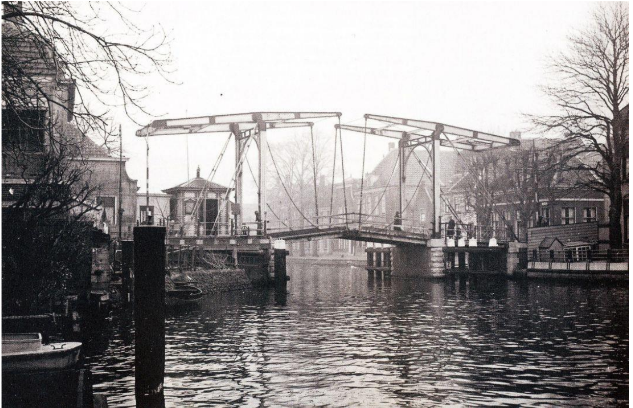
De Alphense Brug in het centrum vóór 1955