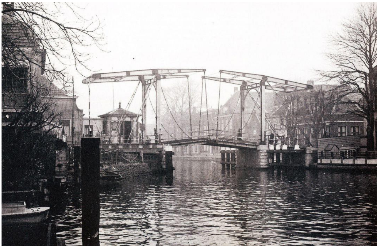
De Alphense Brug in het centrum vóór 1955