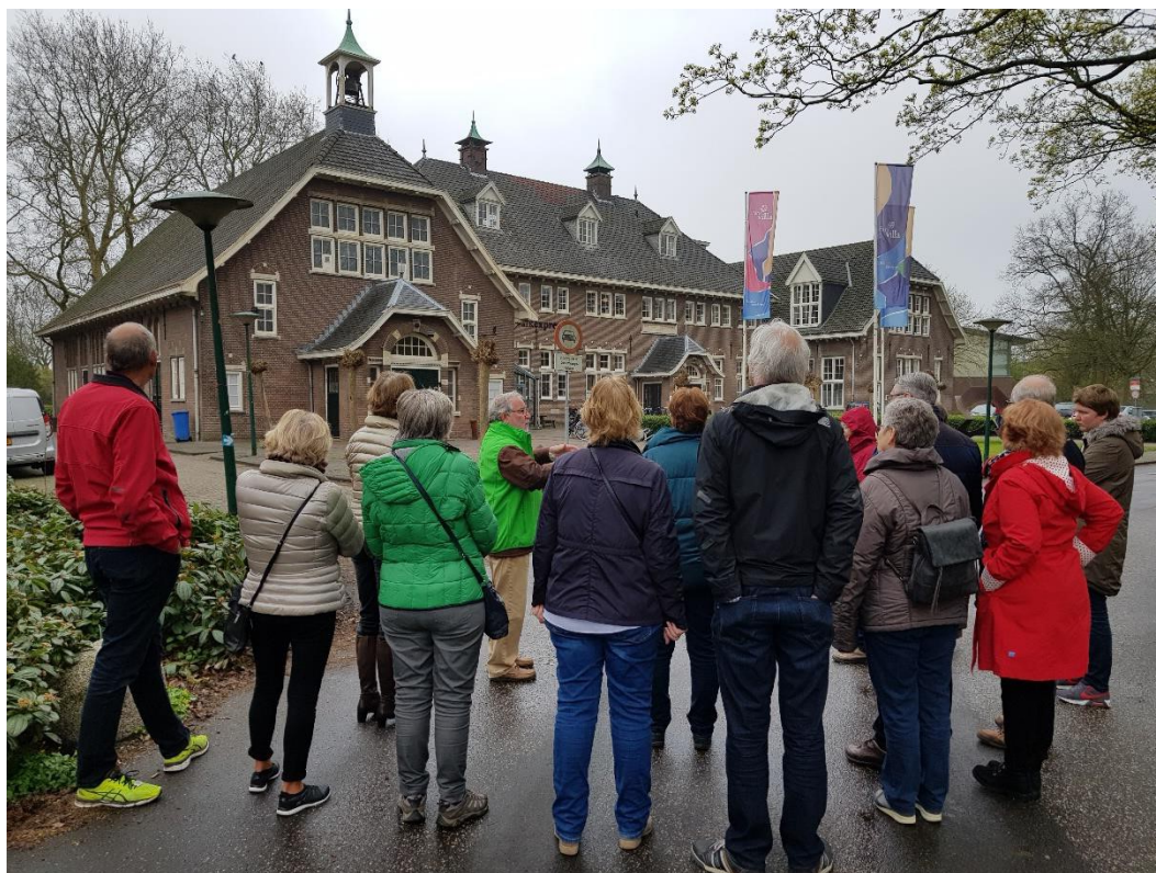
Stadswandeling in Park Rijnstroom