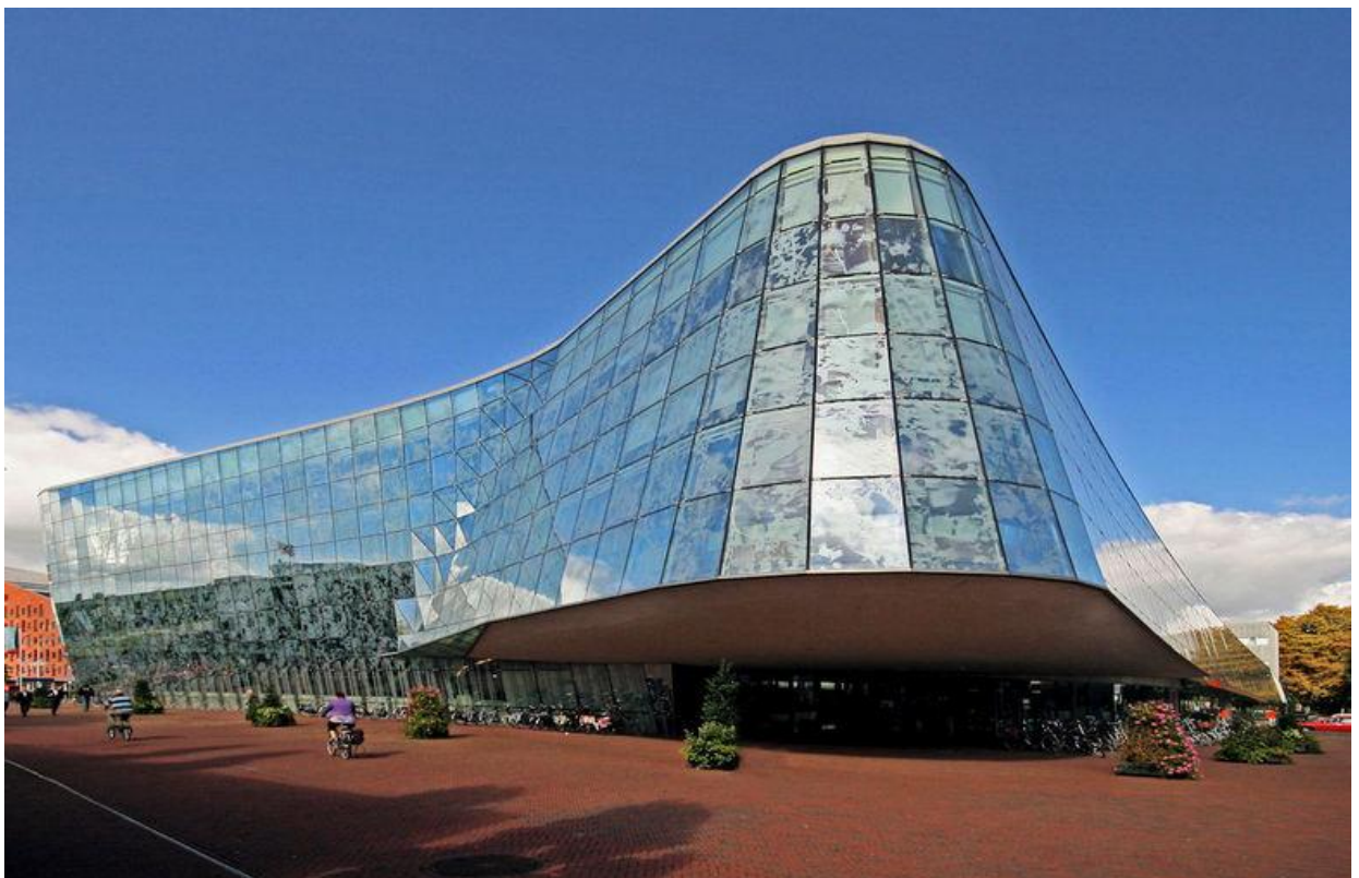
Het stadhuis van Alphen aan den Rijn