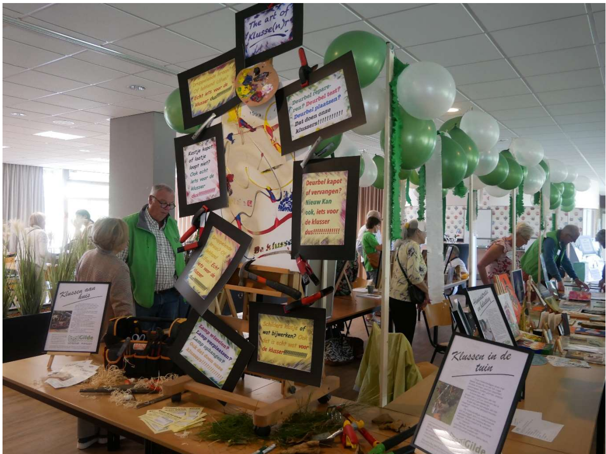
30 jaar Gilde Alphen aan den Rijn.